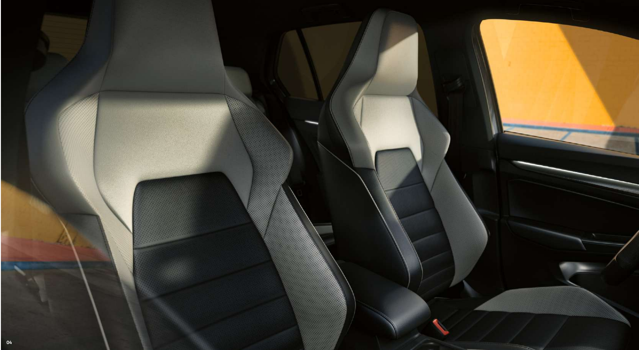
04 Golf GTD jest wyposażony seryjnie w wysokiej jakości przednie siedzenia sportowe Top z regulacją wysokości i podparcia odcinka lędźwiowego kręgosłupa. Fotele zapewniają stabilną pozycję siedzącą, wysoki komfort, mogą być także ogrzewane (opcja). Zdjęcie przedstawia opcjonalną tapicerkę skórzaną Vienna. S

wyposażenie standardowe S wyposażenie dodatkowe O